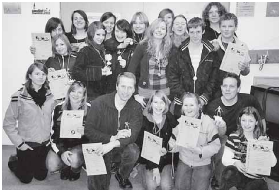
Alle Kaufbeurer Medaillengewinner bei den schwäbischen Meisterschaften