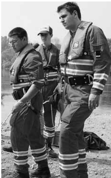
Die persönliche Schutzausrüstung muss von den Helferinnen und Helfern selbst bezahlt werden

Falls ein Helfer im Einsatz die persönliche Schutzausrüstung nicht trägt und zu Scha-