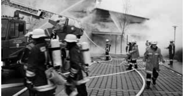
Alle Hände voll zu tun hatten die Feuerwehrleute, um die Ausbreitung des Brandes zu verhindern

Unklar war die weitere Entwicklung und die Frage, ob Personen in den nahegelegenen Wohnheimen für Senioren und Behinderte eventuell evakuiert werden müssen. Vorsorglich wurde deshalb die Sanitätseinsatzleitung alarmiert. Vor Ort waren stets Sanitäter, um die Sicherheit der Feuerwehrleute sicher zu stellen. Auch der Betreuungszug