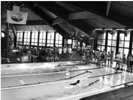
Bei der Modernisierung des Hallenbades sollen die Sport- und Lehrschwimmbecken erhalten bleiben

Wir werden gespannt beobachten, welche Maßnahmen seitens der Stadt Kaufbeuren konkret ins Auge gefasst werden und werden versuchen, Sie in den nächsten Ausgaben von DLRG-AKTUELL stets auf dem Laufenden zu halten. ✧