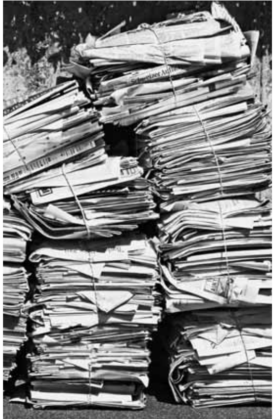
Altpapier ist zwischenseitlich ein gefragter Wertstoff

Wir würden uns freuen, wenn wir anstelle eines Einbruchs sogar eine Steigerung erzielen könnten.