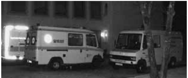
Sanitäts- und Betreuungskräfte waren bei dem Großbrand in Marktoberdorf vor Ort. Die UG-SanEL war ebenfalls dabei, für den Fall einer weiteren Ausbreitung und einer möglichen Evakuierung

des Roten Kreuzes aus Pfronten rückte an, um die Helfer zu verpflegen.